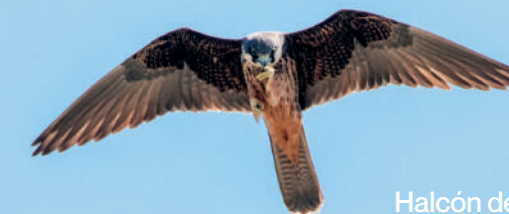
Halcón de Eleonora

En la provincia de Castellón encontramos diversidad de espacios naturales protegidos, y en el Sur coinciden varias figuras de protección de la Red Natura 2000, así como humedales catalogados, varias microrreservas de flora, un Paraje Natural Municipal y un Parque Natural. Por ello, podemos encontrar una gran variedad de aves incluyendo muchas que adquieren la categoría de objetivo para los birdwatchers.